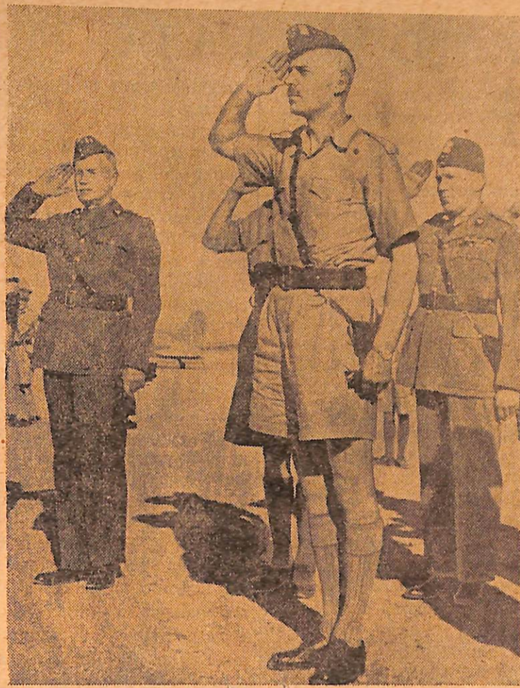
Inspektor P. S. Z. na S. W. gen. W. Anders

Polacy, wiem, że Rząd któremu przewodnicze rozporządza zaufaniem narodu. Jest on wiec mocniejszy od rządów, rozporządzających nawet największą siłą fizyczną. Staramy się wszystkimi sposobami tego zaufania nie zawieść. Lecz i na odwrót zaapelować muszę do was wszystkich rozrzuconych przez wojnę na całej kuli ziemskiej o zbiorową dyscyplinę narodową. Nie tylko o stała czuła troskę oraz pamięć o tych, którzy cierpią i walczą, ale o karność, zapewniającą naszym niezwykle ciężkim wysiłkom sukces trwały i całkowite powodzenie. Wymaga tego od was nasz niezłomny bohaterski na od, wymaga interes wojny, w której zwycięży zachodnia cywilizacja prawdziwie chrześcijańska”.