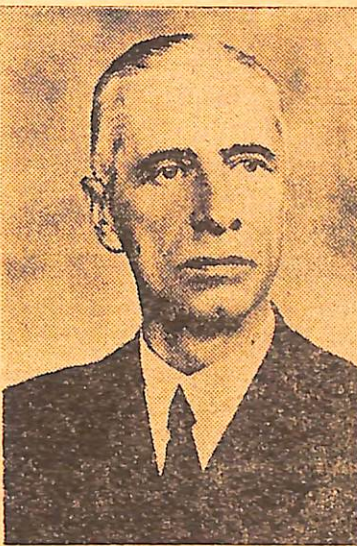
Prezydent R. P. Wl. Raczkiewicz

A Bog i Najswietsza Panna zeslali Mu Wodzow, hartem ducha godnych wielkosc Polskiego Plemienia.