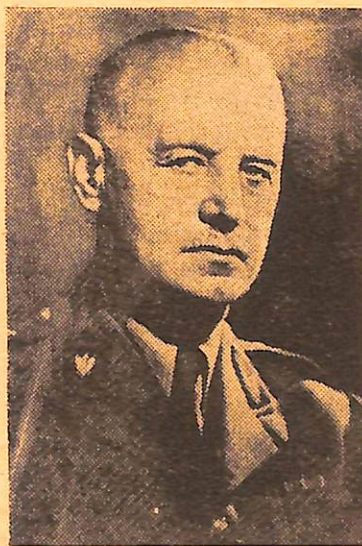
Naczelný Wodz Wl. Sikorski

Pan Prezydent R. P. Wladyslaw Raczkiewicz i Premier oraz Naczelný Wodz Generali Broni Wladyslaw Sikorski 27 czerwca obchodzili dzien swoich Imienin.