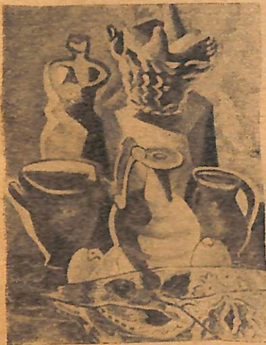
Severini — martwa natura

impresjonistów z pośród Polaków aż do bardzo dojrzałych kontynuatorów kubizmu i innych odmian tzw. futuryzmu. Jest więc wyraźny przekrój tego, czym jest naprawdę współczesne malarstwo europejskie, choć dla szerokiej publiczności jest ciągle jeszcze tworem niezro-