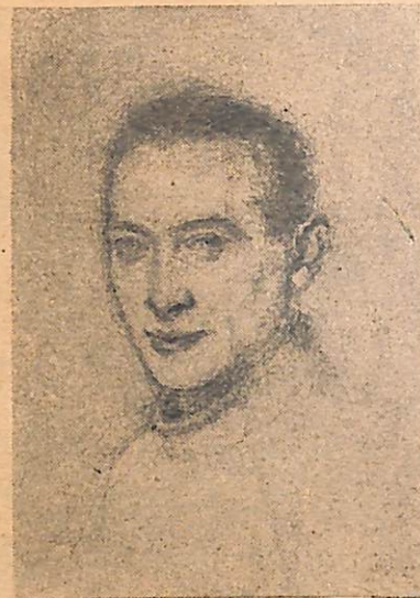
M. Bohusz-Szyszko — portret

Teraz w stolicy Włoch rzucono przed oczy publiczności pokaz o zupełnie swoistym obliczu pod względem zasięgu i charakteru. Po mniej więcej półrocznych wysiłkach organizacyjnych, z niepoślednim udziałem Polaków, zawiązało się