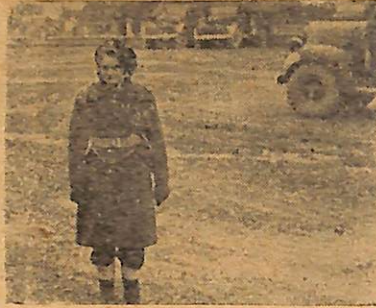
Służbowa z komp. transp.