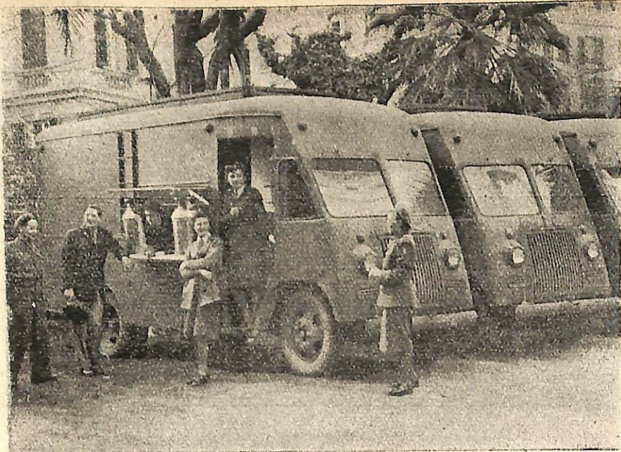
Nowe wozy - kantyny