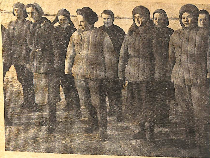
Ochotniczki w „fufajkach“

Potem dopiero „dorastaliśmy“ do życia. Powstała wielka ośmiornica — problemat ochotniczek. Romantyczność pierwszych okresów armii zdała się dla wielu słodka i naiwna. Miejsce jej zajęła ważna zawilść życia zorganizowanego i z tej otchłani wyłowię dziś zagadnienie stosunku kobiety do grupy społecznej w warunkach obecnych.