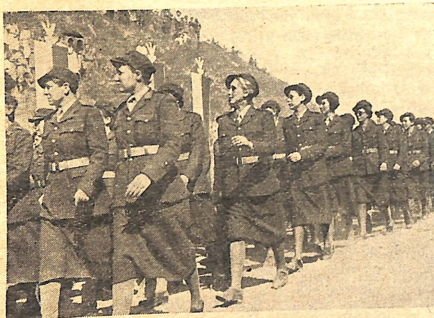
3. maja w Jangi — Jul