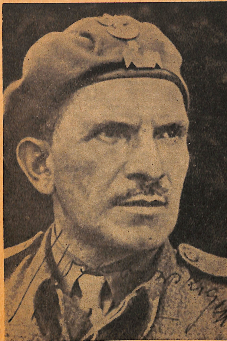
Gen. Bryg. Stanisław Sosabowski D-ca Polskiej Brygady Spadochronowej

Pod nami są jakieś lasy i błyszczą w słońcu kanały. Nie widzimy prawie wcale dróg i nie wiele dostrzegamy śladów ludzkiej, zbiorowej obecności. Ani jednego większego zgrupowania domów, prawie żadnego ruchu na szosach. Po soczystej zieleni angielskiej