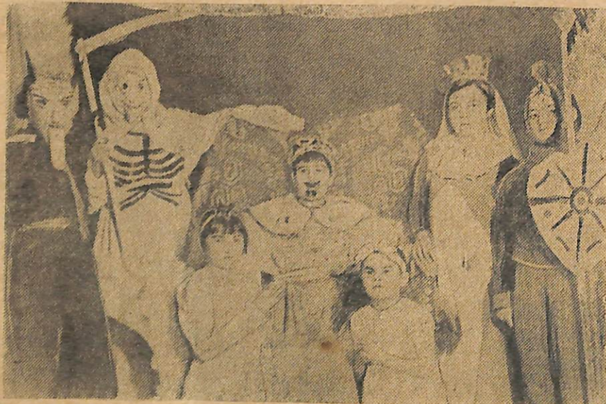
Scena zbiorowa z Jaselek