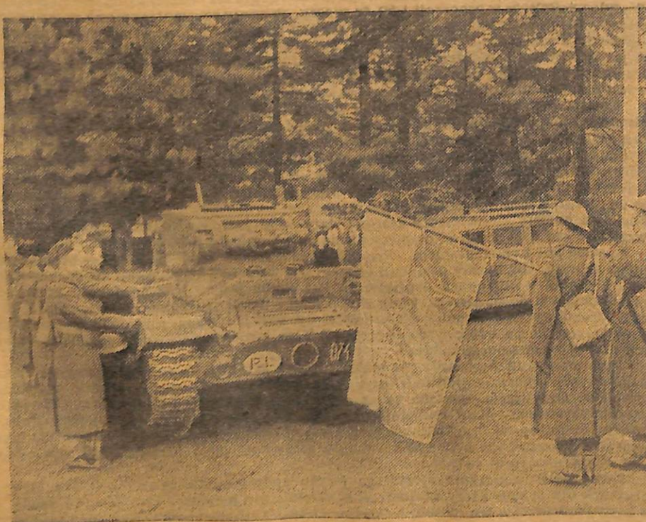
Zaprzysiężenie brygady pancernej w Szkocji