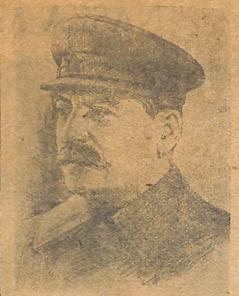
MARSZ. JOZEF STALIN Nacz. wódz sił zbrojnych ZSRR

— Z tego jednak nie wynika — brzmi dalej rozkaz — że hitlerowska armia jest już wykonczona i że Armii Czerwonej nie pozostaje nic innego, niż sciganie jej do zachodnich granic naszego państwa. Tak myśleć — to znaczy ulegać nierozsądnym i szkodliwym złudzeniom. Nieprzyjacieli poniosł klęskę, ale jeszcze nie jest pokonany. Niemiecko-faszystowska armia przeżywa pod wpływem ciosów otrzymanych od Armii Czerwonej kryzys, ale to jeszcze nie