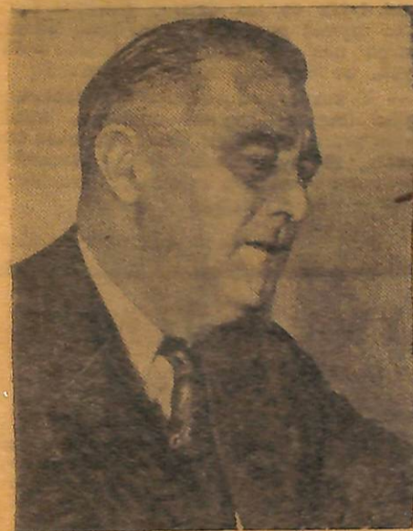
FRANKLIN ROOSEVELT Prezydent Stanów Zj.

I dalej mówi o tem, że przecież Afryka Północna liczy 16 milionów ludzi, z czego lwią większość stanowią muzułmanie. Utrzymanie spokoju na tyłach półmilionowej armji sojuszniczej jest nakazem najwyższej wagi. Jest to stanowisko zbliżone do