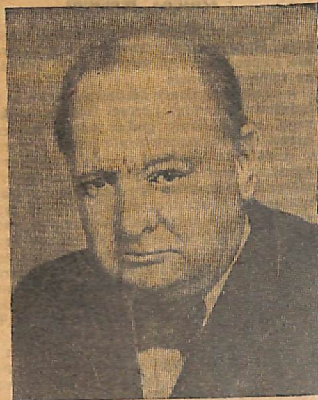
WINSTON CHURCHILL Premjer W. Brytanji

Celem tych operacji jest więc otwarcie dostępu do Europy. Churchill udzielił więcej wyjaśnień o charakterze technicznym: