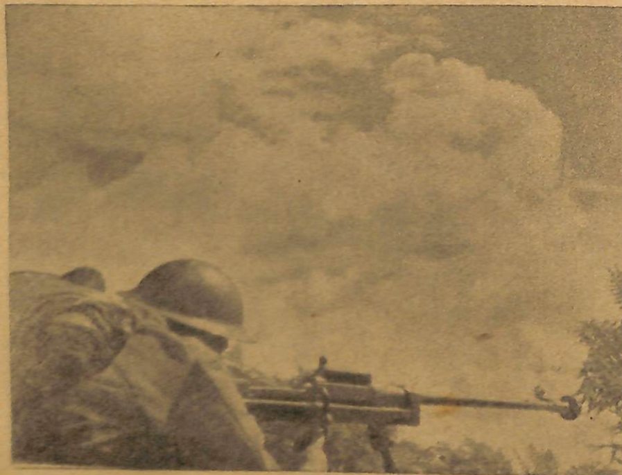
Cekam, piękna bron..