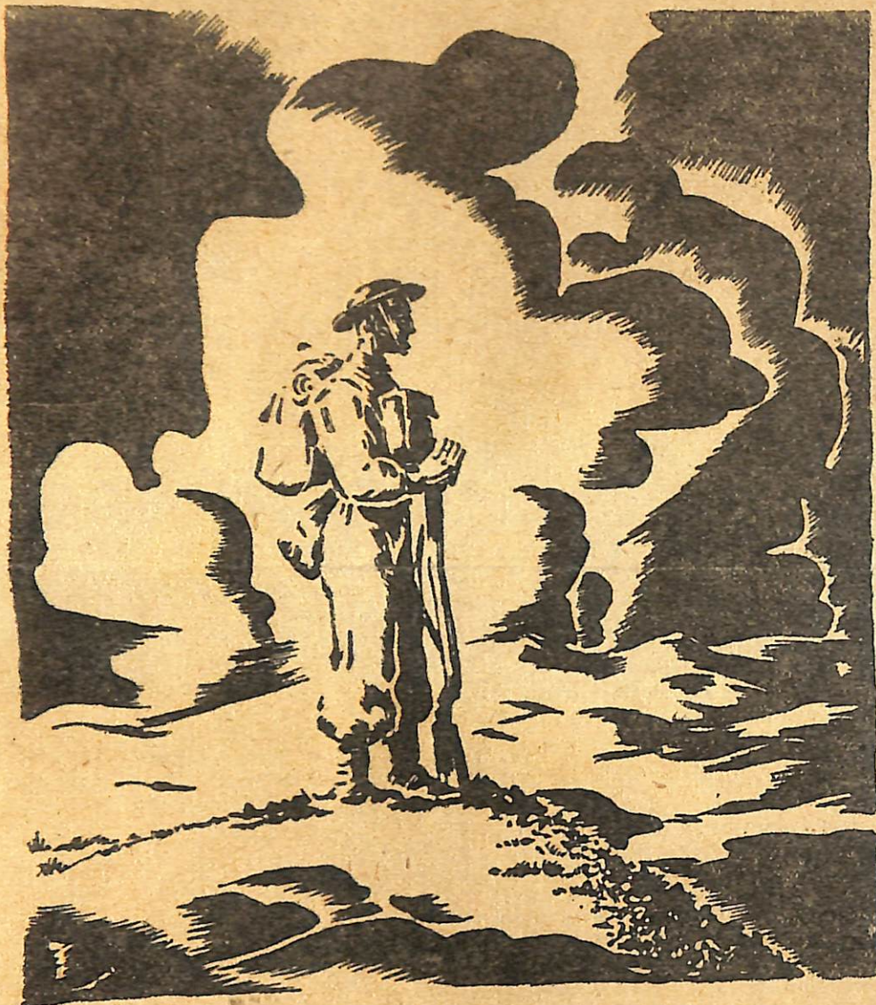
Żołnierz polski nad szkockim brzegiem